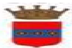
Comune di Iglesias